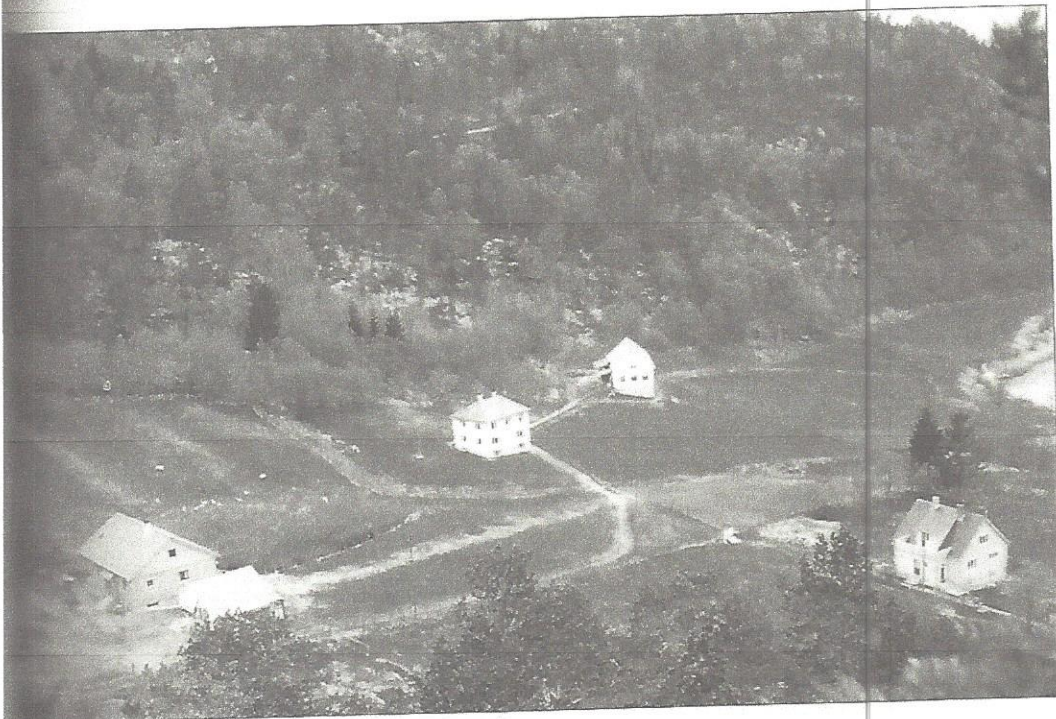
Gravdal. Til venstre bnr. 3, til høgre bnr. 1.